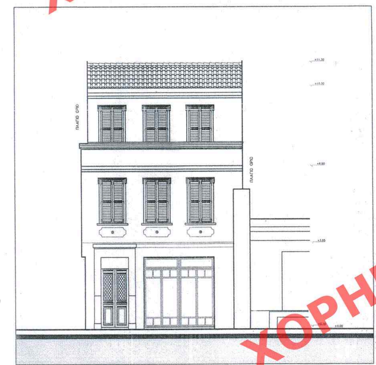
ΟΨΗ ΟΔΟΥ ΑΙΣΩΠΟΥ - ΔΙΑΤΗΡΗΤΕΟ