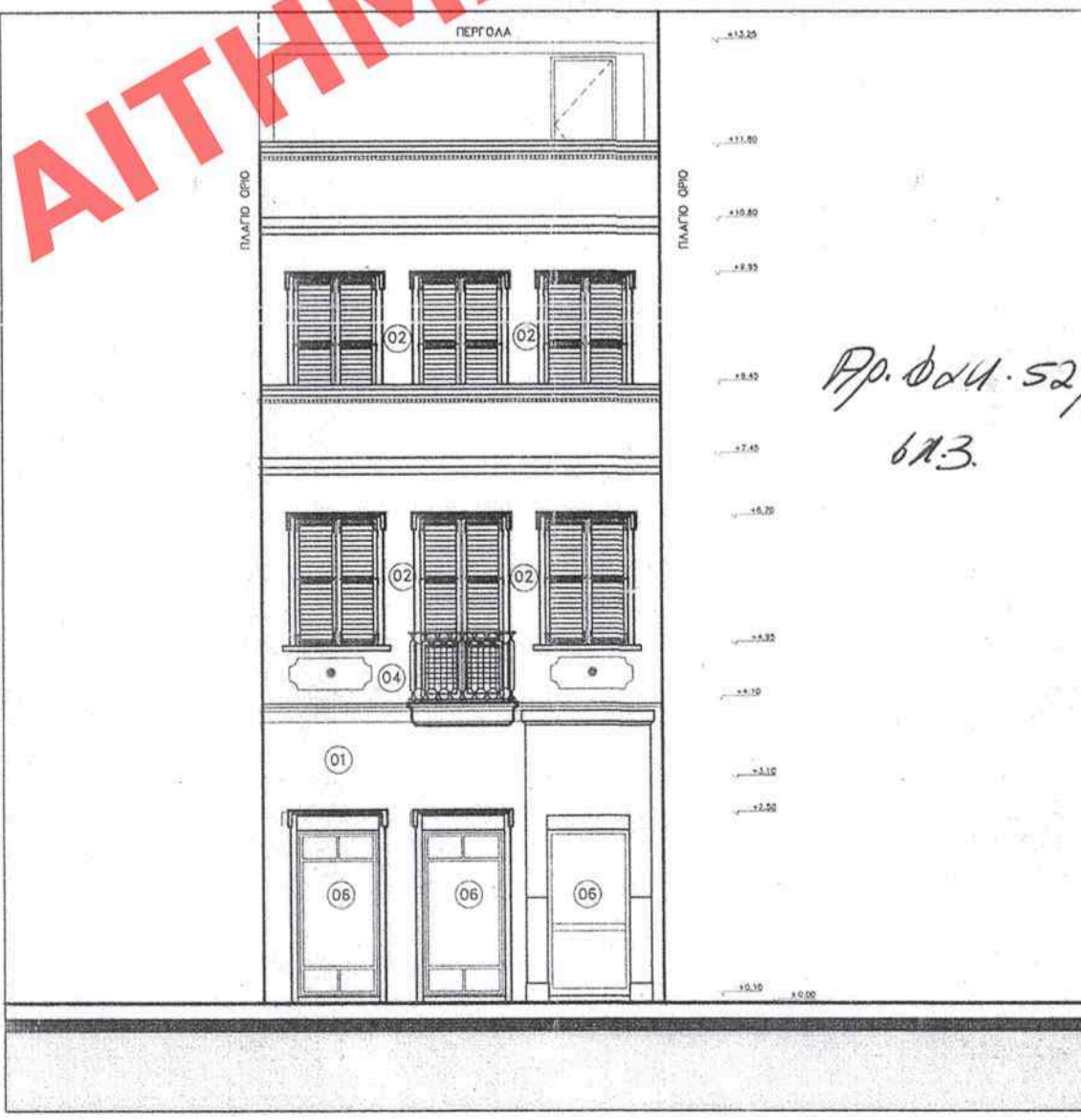
ΟΨΗ ΟΔΟΥ ΜΥΚΩΝΟΣ